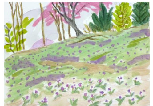
6. 坂戸山片栗の原っぱ(24x33)原山 恵津子