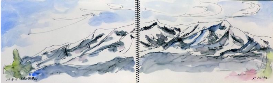
1. 飯豊連峰（26x86） 小出 和子