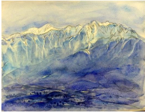
3. 青霞む南アルプス(前三つ頭より)(32x40) 菅沼 満子