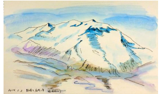
4. 至仏山(21x34) 田中 正雄