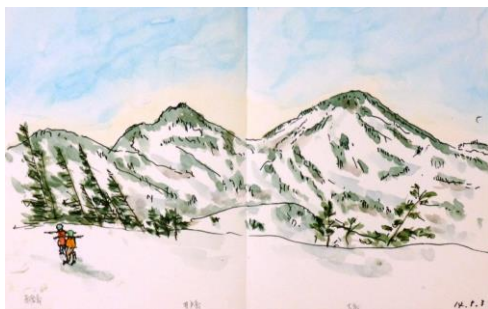
7. 八甲田山（24x38） 芳野 菊子