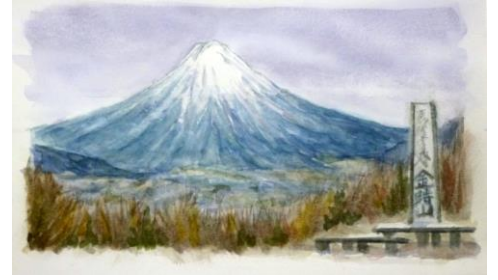
2. 金時山から(14x24) 小松 忍