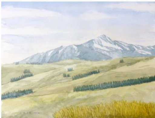
5. 礼文山(33x41) 都崎 修男