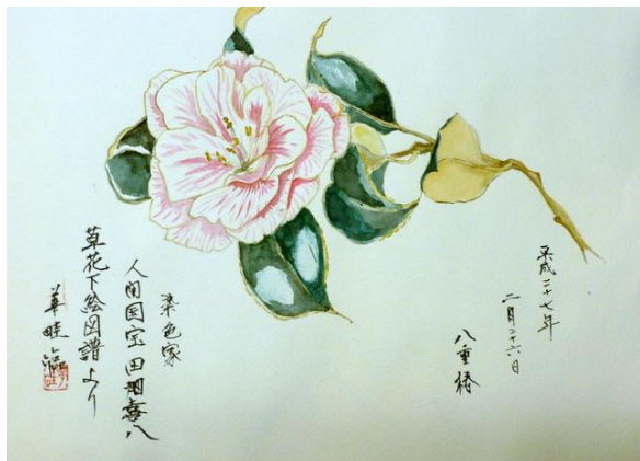
1. 八重椿 (25x34) 小出 和子