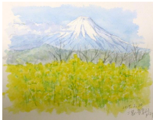
2. 吾妻から (14x24) 小松 忍