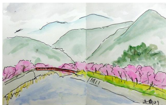
4. 河津桜 (18x28) 芳野 菊子