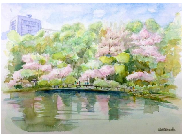
5. 新宿御苑 (25x34) 渡部 温子(新会員)