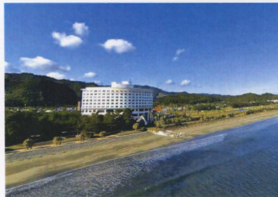
会場: ANAホリデイ・インリゾート宮崎