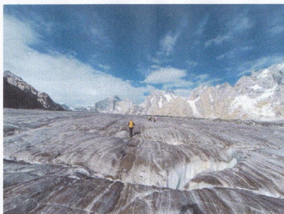
ピアフォ氷河を進む