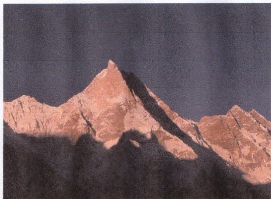
1985年に初登攀したマッシャーブルム北西壁