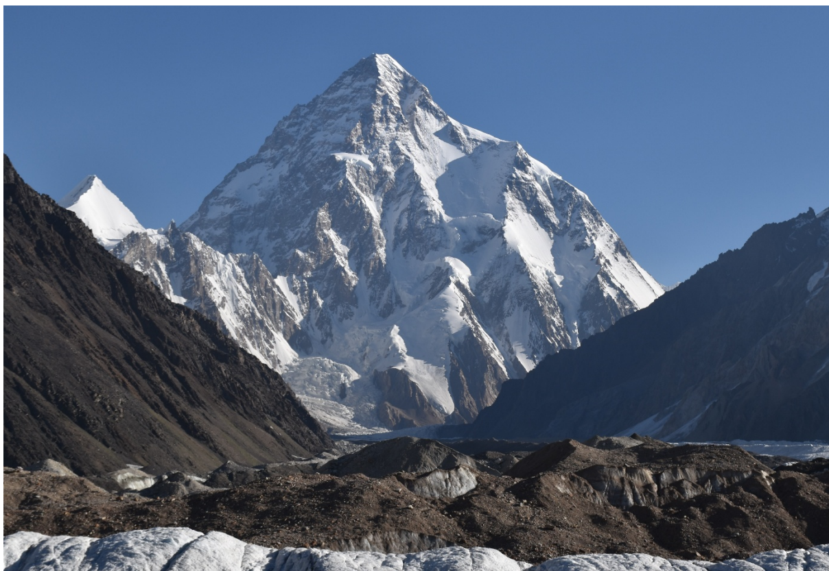
コンコルディアからの K2