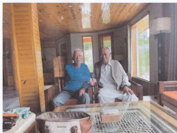
1977年の日・パK2登山隊の隊員と48年ぶりに逢った