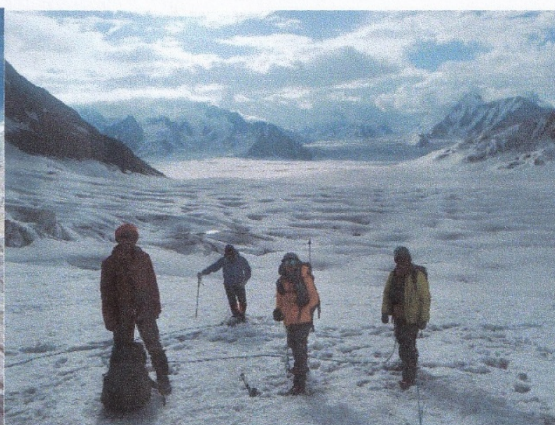
広大なスノーレイクを背に