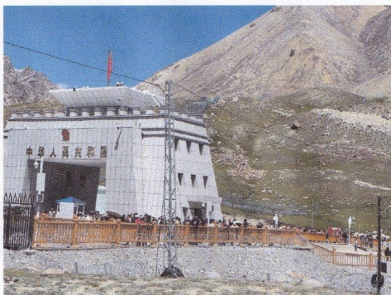
クンジェラブ峠の国境検問所