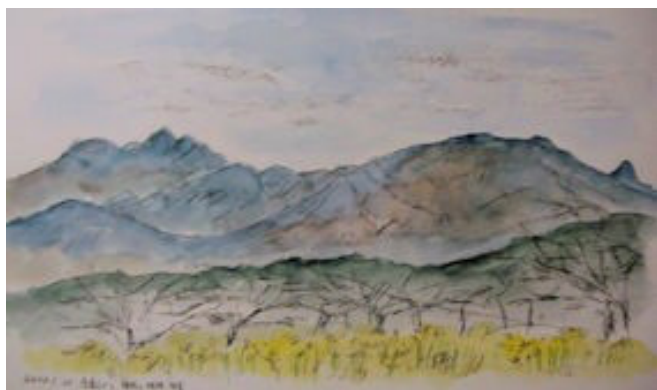
吾妻山から箱根の山々