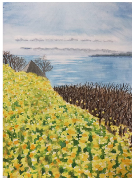
吾妻山で菜の花と相模湾