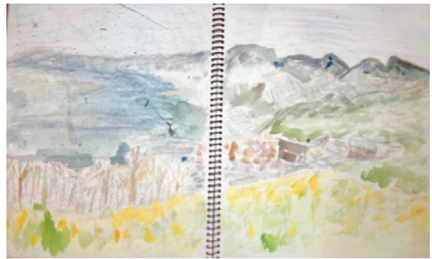
吾妻山公園より相模湾 清水節美