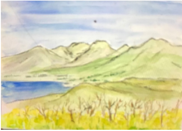
吾妻山公園より相模湾、箱根 芳野菊子