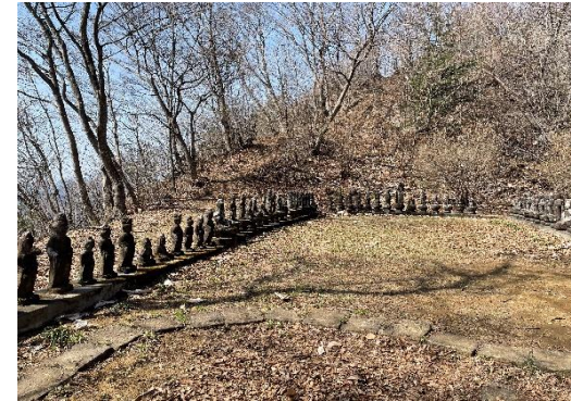
弥勒菩薩と観音様