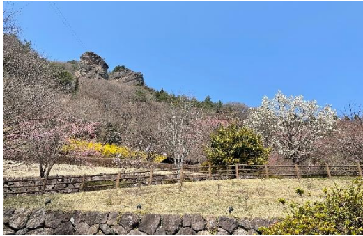
道の駅たけやまから周回