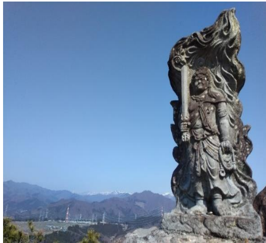
不動岩上の不動明王