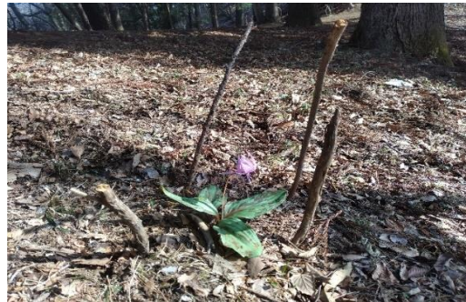
天狗の広場 カタクリ