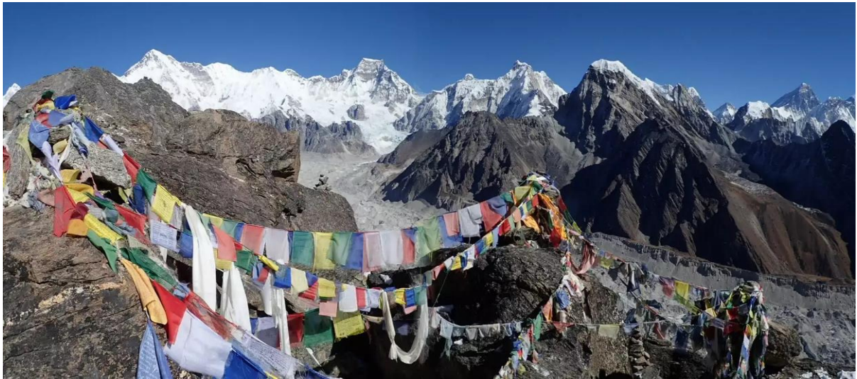
Gokyo Ri (5357m) 展望