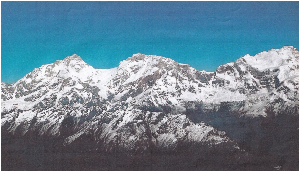
マナスル 3 山