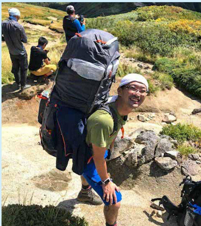
飯豊連峰で40キロの荷物を背負って撮影歩荷

礼文島の北部に久種湖という日本最北の湖がありますが、その湖の近くにある日蓮宗寺院、妙慶寺の副住職をしております。普段はお檀家さんの家に月参り(これは北海道だけの文化)を行っているのですが、時折、NHK「にっぽん百名山」の撮影補助をしたり、地熱発電所の建設適地を探すために日本中の温泉地域に機材を背負って赴いたり、森林調査のために日本中の森を踏査したりしており、さらに今年からは、JMGA(日本山岳ガイド協会)のガイド資格や北海道アウトドアガイドのカヌーガイドの資格を取得して、礼文島のアクティビティを充実させ、ゲストハウスも開業しようと現在勉強中であります。