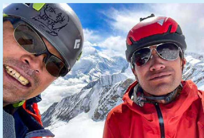
初登頂したサウラヒマールで。左が筆者

さて、簡単にはなりませんが、僕のこれまでの経歴を紹介させていただきます。18歳まで礼文島で過ごし、僧侶になるために山梨県・身延山にある日蓮宗の大学に入学して勉強しました。その後、このまま僧侶になっても面白くないと思い、陸上自衛隊に入隊。千葉県木更津市にある日本最大のヘリコプター部隊に勤務し、東日本大震災のときは発災翌日から被災地に派遣されました。